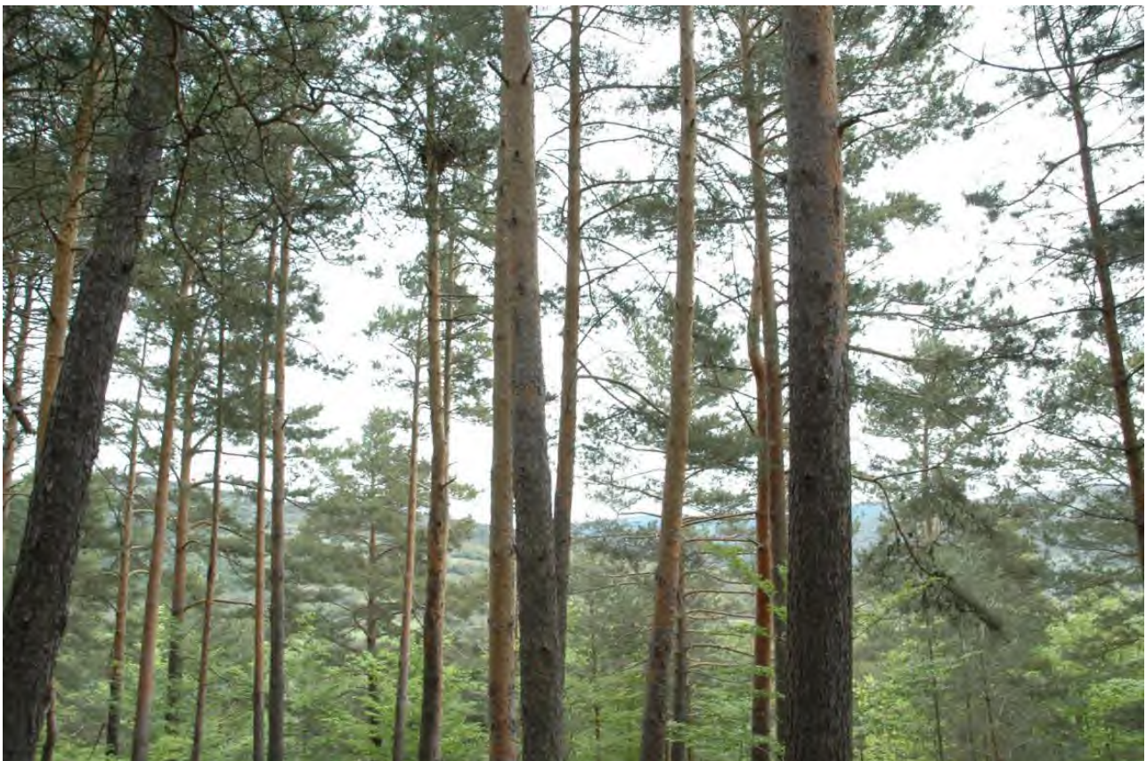
Fotografía nº 6. importancia y calidad del aprovechamiento maderero.