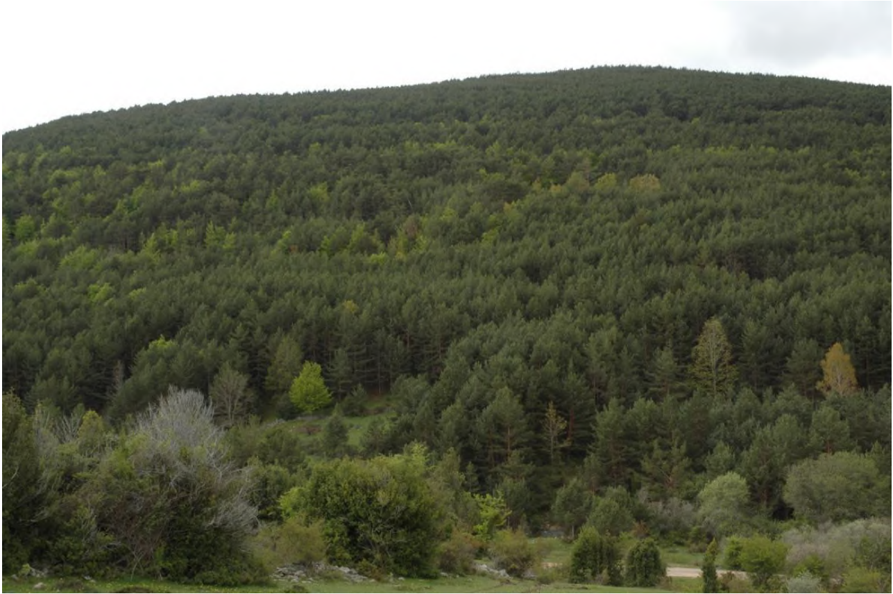
Fotografía nº 1. visión general del monte.