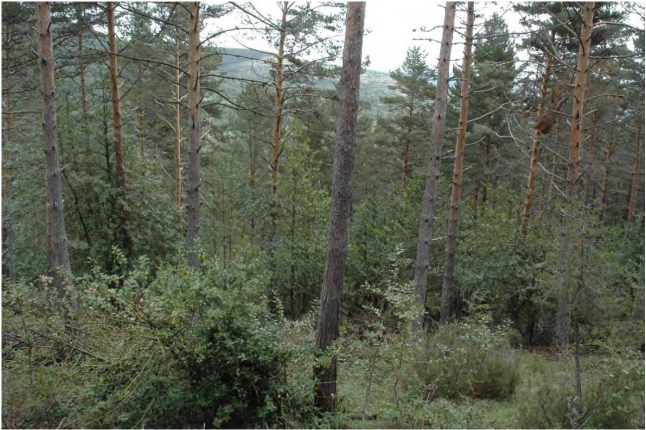
Fotografía nº 3: entremezcla pinos-acebos