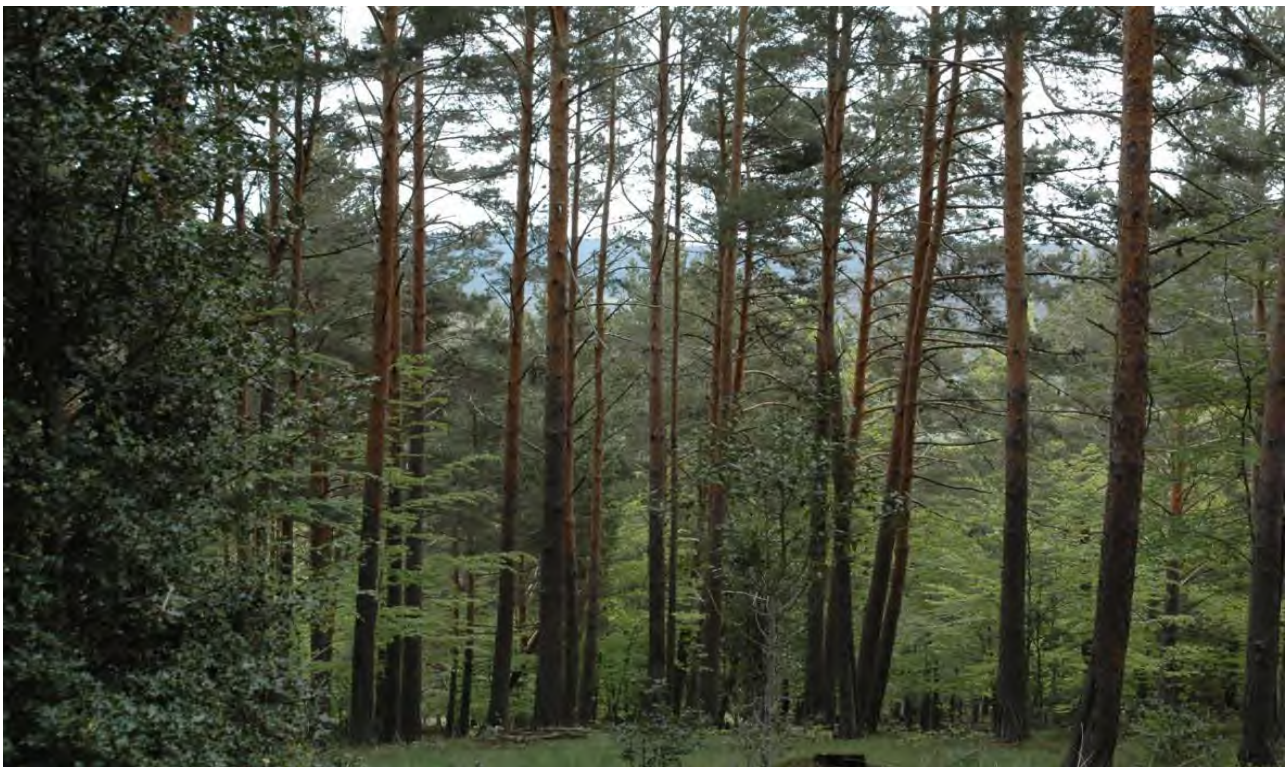
Fotografía nº 2: vista interior del monte.