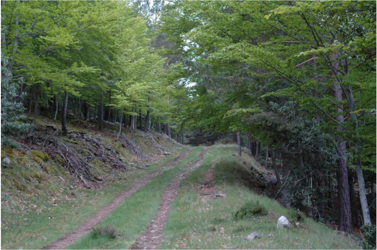
Fotografía nº 5: Vista de la red interior de caminos.