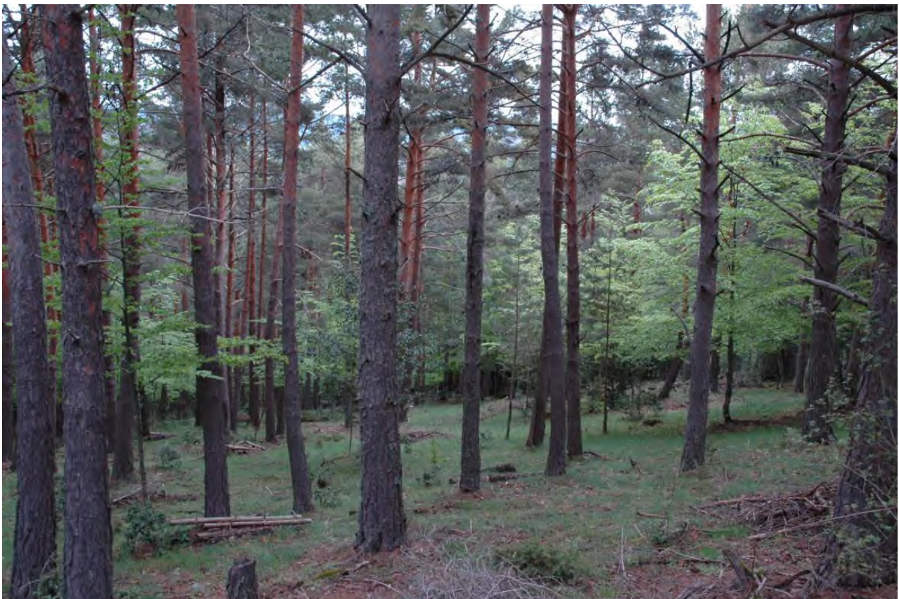
Fotografía nº 4: entremezcla pinos-hayas